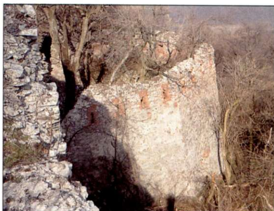
Neskororenesančná delová bašta

dovaná mohutná delová bašta. Táto svojimi štyrmi stenami so zošíkmeným vonkajším lícom bránila juhovýchodné predpolie. Interiér bašty bol sprístupnený z južného predhradia v skale vytesaným tunelom a prepojený s pivnicou v mieste prejazdu niekdajšej vstupnej stredovekej veže. V dolnej úrovni bašty sa dodnes zachovali tri komorové strielne pre veľké delá a v korune muriva kľúčové strielne s tehlovým ostením.