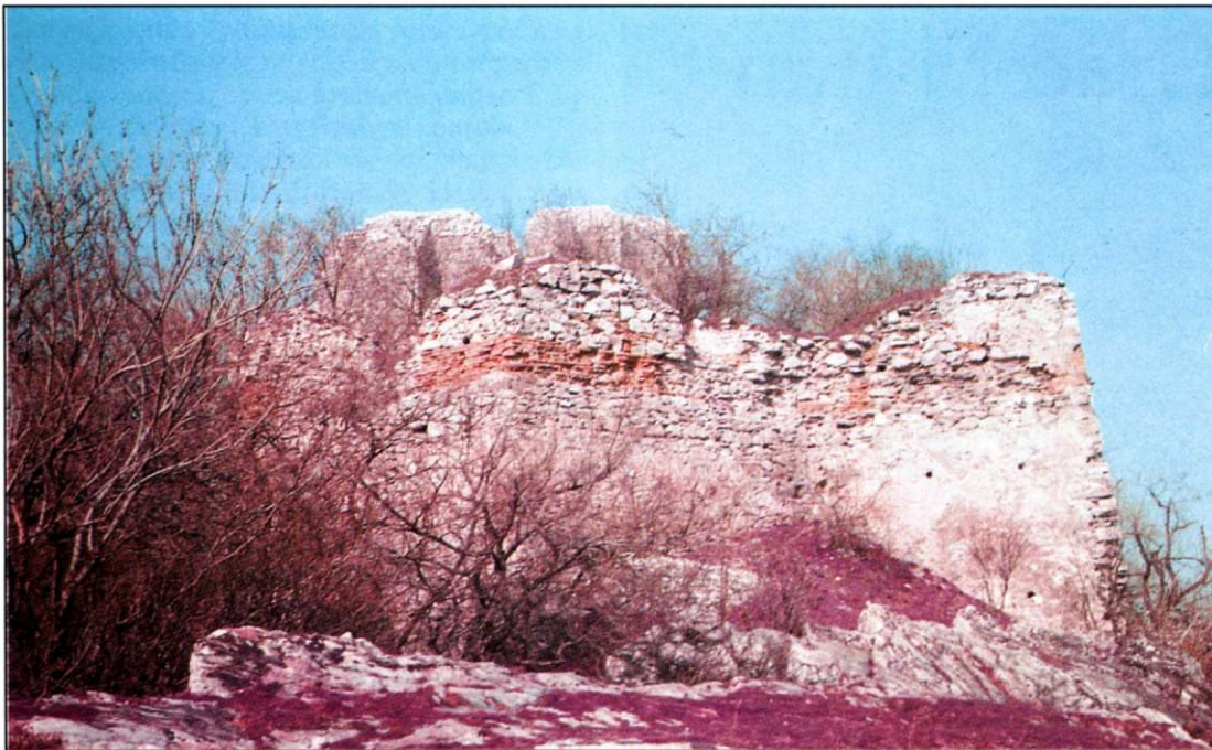
Bastiónové opevnenie južného predhradia