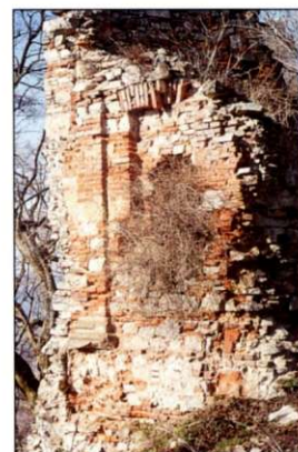
Zvyšky plastickej výzdoby priechlia barokovej vstupnej brány